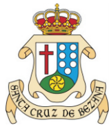
AYUNTAMIENTO SANTA CRUZ DE BEZANA CONCEJALÍA DE DEPORTES Y JUVENTUD